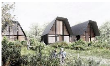
Grafik: Concept ApS/Niras