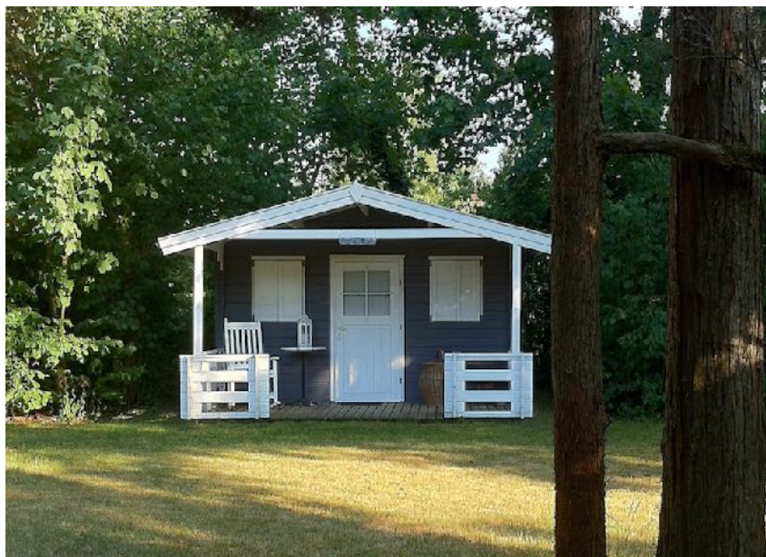
For første gang i 16 måneder er prisen på sommerhuse faldet.