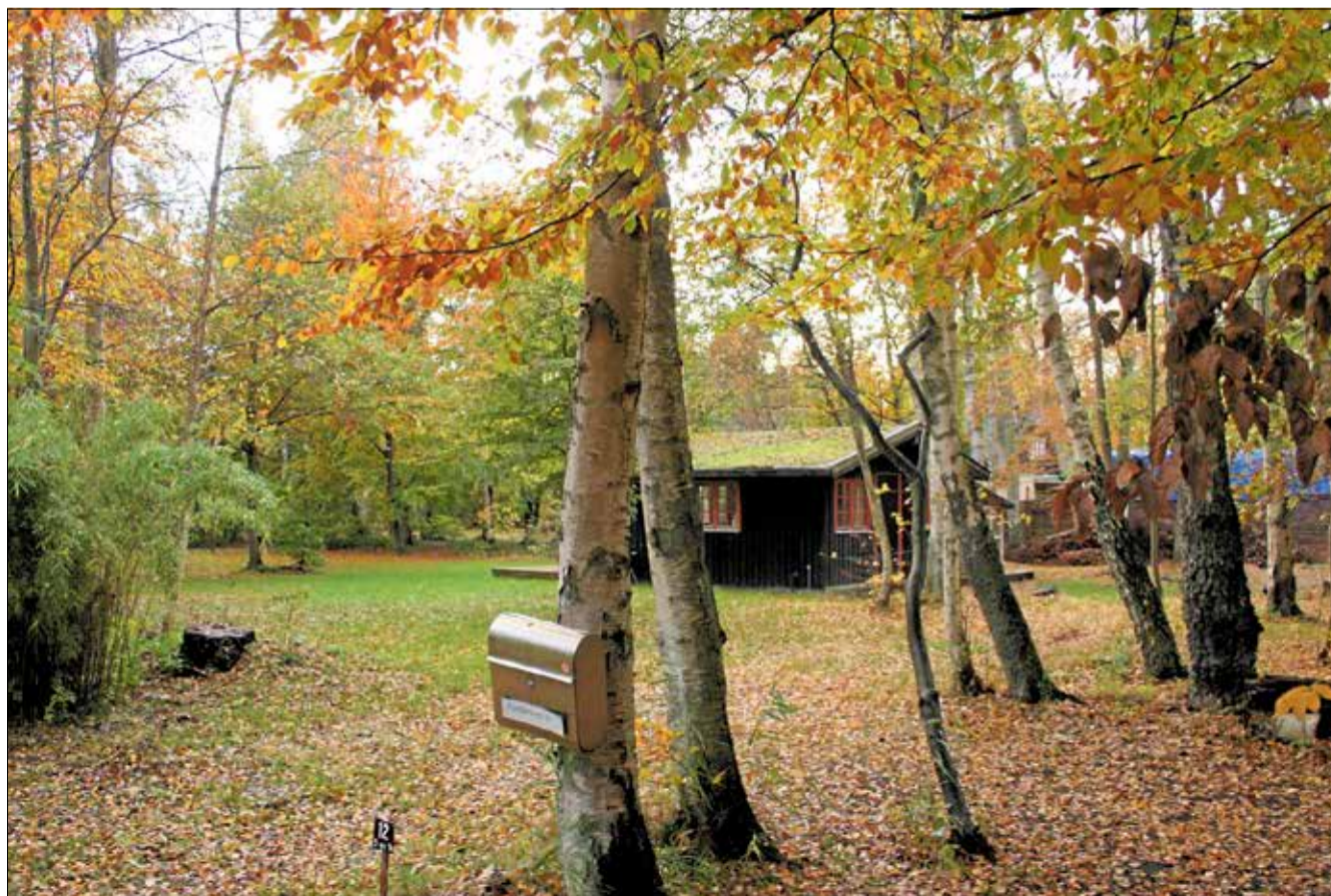
Et stort flertal i byrådet forventes torsdag at underkende forvaltningens indstilling om et §14-forbud der skal bremse udstykning af denne grund i Asserbo indtil en ny samlet lokalplan for hele området er klar.

Det vil give mulighed for at opføre sommerhuse mager til dem på Asserbohusgrunden på 250 kvadratmeter med yderligere en bygning på 50 kvadratmeter på hver grund. Adressen Den Korte Vej 1 ligger helt ud til Nyvej og er i dag tæt bevokset og kun bebygget med et sommerhus på 150 kvadratmeter.