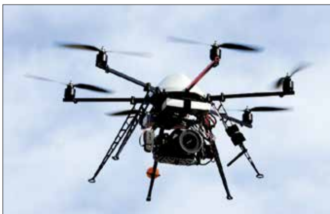
Droner kan til næste sommer bringes i spil langs Nordkysten som et supplement til kystlivreddernes arbejde.

LIVREDNING: Til næste sommer vil Den Nordsjællandske Kystlivredningstjeneste sætte et pilotprojekt igang med frivillige droneoperatører, som kan holde øje med strande uden livredderposter.