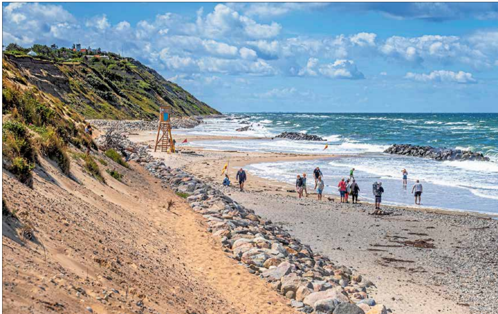
Livredderne kan ikke holde øje med hele Nordkysten, og derfor vil livredderne bruge droner til at hjælpe med at redde liv.