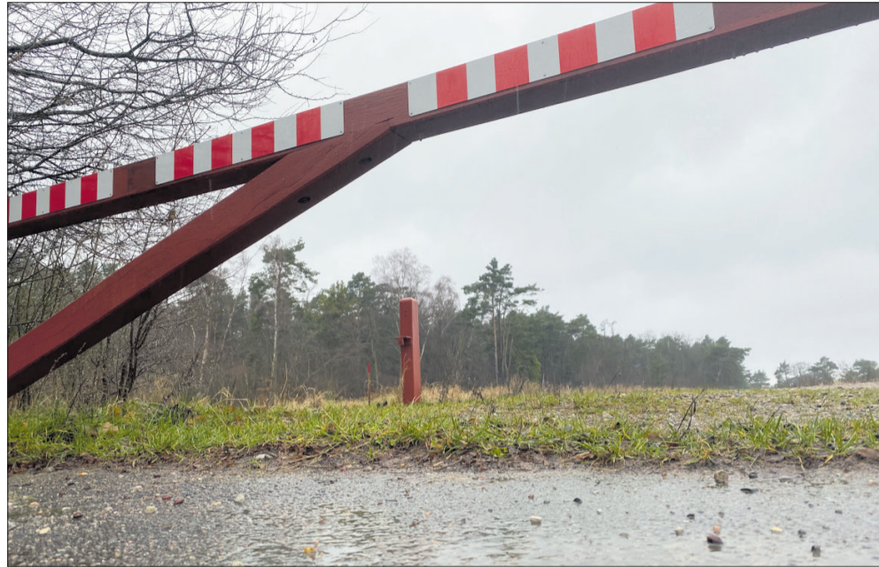
Det er lige på den anden side af bommen, der i sin tid spærrede vejen ned til Melbylejren, at ægteparret ønsker at bygge sommerhuse.

BYGGERI: Et ægtepar ønsker at opføre to byggerier på mere end 200 kvadratmeter lige ved Melby Overdrev på en grund, som de for 11 år siden købte af Forsvaret.