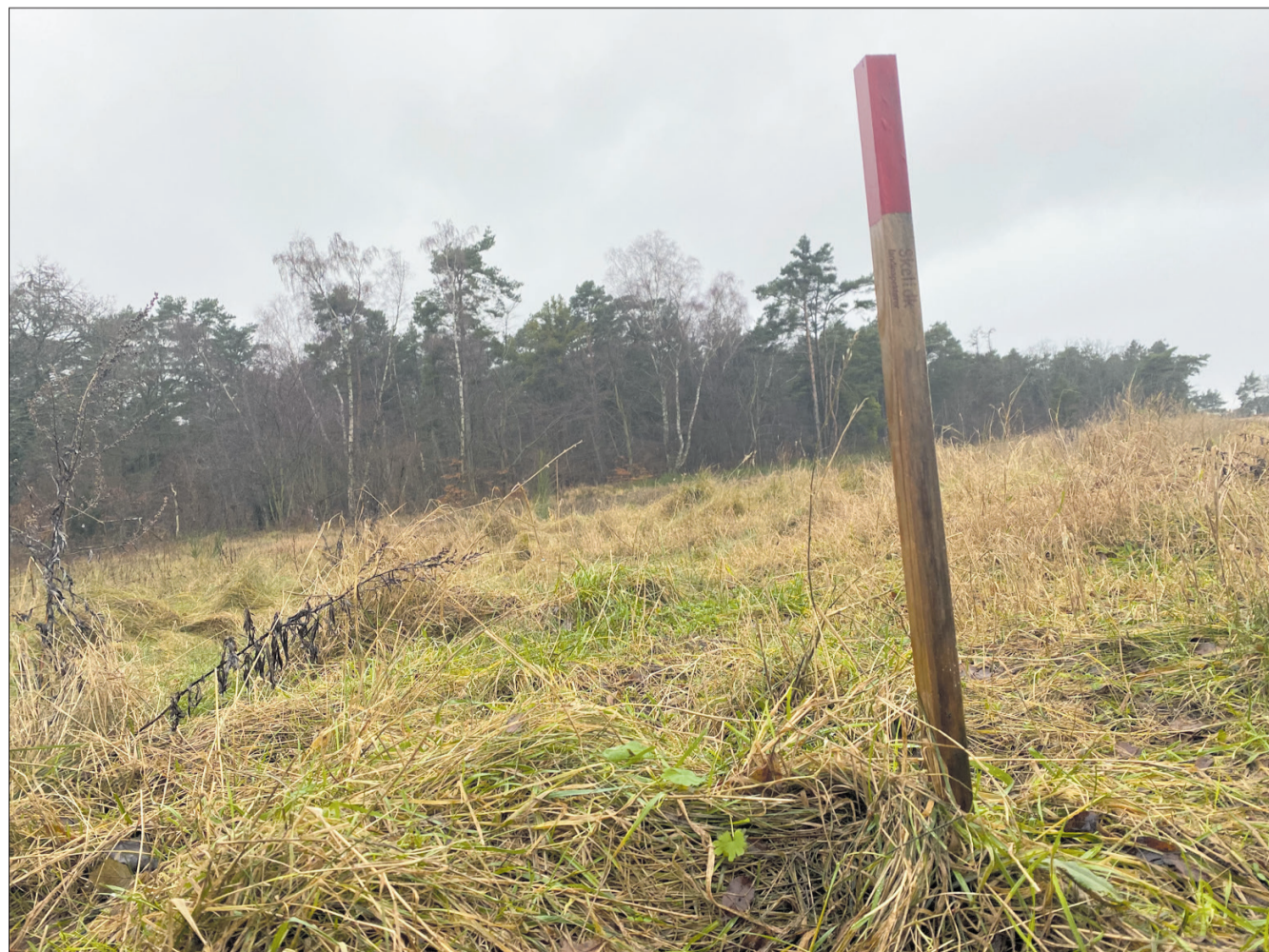
I 2011 købte et ægtepar en grund ved Melby Overdrev af Forsvaret. Her har de planer at bygge to store sommerhuse.

- Det er tale om noget jord, som i sin tid er solgt fra til udvikling, og hvor der ikke er foretaget nogen planlægning. Det er lidt det samme, som skete på Asserbohus-grunden, og der spiller det selvfølgelig ind, at vi har oplevet det tidligere og set, hvad det kan medføre, siger Steffen Jensen.